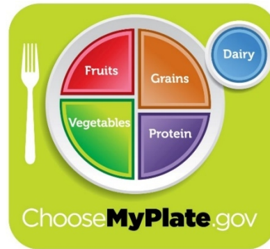
„My plate“ in den USA

Weitere Beispiele sind die Schüssel von Guinea-Bissau in Westafrika oder auch „My plate“ in den USA. Mit diesen Schemata lassen sich die wichtigsten Prinzipien einer gesunden Ernährung besser verstehen. Gleichzeitig werden mit den einzelnen Darstellungen die verfügbaren Ressourcen und kulturellen Gewohnheiten jedes Landes berücksichtigt.