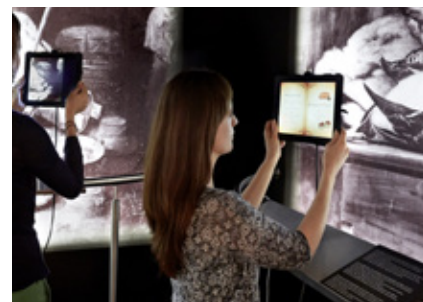
scénographie Délices d'Artistes