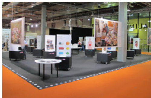
Scénographie "Je mange donc je vis"

Inaugurée en 2012 au Comptoir suisse, l'exposition est traduite en allemand à l'occasion de sa présence à la Foire de Zoug (octobre 2013), en partenariat avec l'invité d'honneur, le Canton de Vaud. Elle est enrichie d'un 5 e secteur consacré au lait afin de mettre en lumière, via un aliment emblématique, le lien historique qui unit Vevey et Cham au travers des parcours d'Henri Nestlé et de George Page. Elle est vue par près de 80'000 visiteurs.