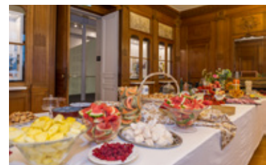
Somptueux buffet de style Renaissance Vernissage Délices d'Artistes