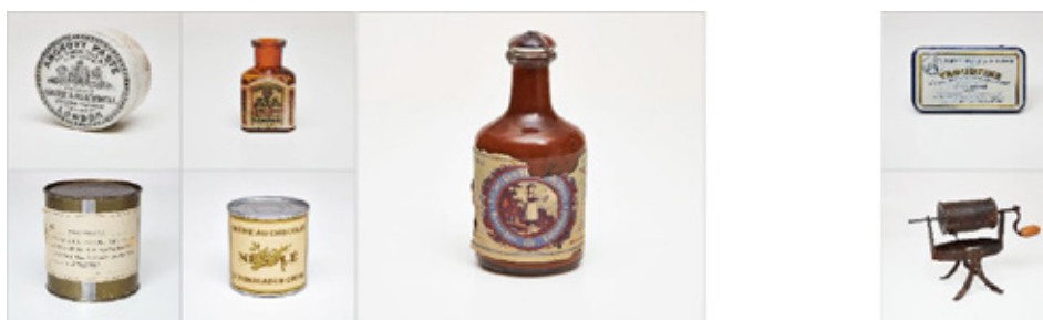
Présentation de la eCollection

En 2013, la préparation des collections en vue du projet Alimentarium 2016 s'est poursuivie. La digitalisation des objets de la collection est terminée, du moins pour tous les objets avec une documentation iconographique. Entre octobre et novembre 2013, 300 objets de la collection ont été nettoyés et photographiés à 360°, en haute définition, puis documentés. Ce projet de eCollection est destiné à alimenter les futures plateformes « online » de l'Alimentarium.